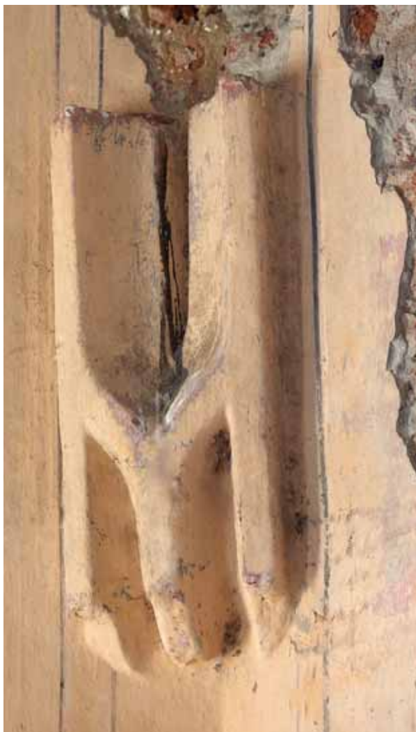
6. Boltindítás a szentély délkeleti sarkában