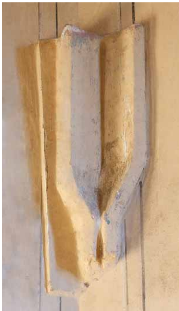
4. Boltindítás a szentély záradékfalának déli sarkában

A hajóban középkori részlet nem látható. A szentély belsejében, az északi falon előkerült a nyomott számárhátívvel záródó sekrestyeajtó. Keretének laposan kidolgo-