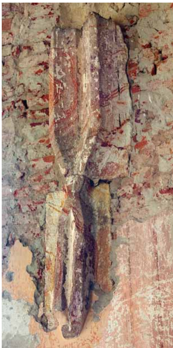
5. Boltindítás a szentély déli falán

profilozás fut körbe. E felett vízszintes, fogrovatból és szímatagból álló profilú párkányra ül rá a fülkekeret. A keret profilja kímatagból és lemeztagból áll, s alul merőlegesen befordul a nyílás felé. A szerkezetet fent újabb vízszintes párkány zárja le, két negyedhomorlat közt fogrovatból álló profillal. A szentély déli falán, a keletre eső ablak alatt szegmensíves lezárású, falazott ülőfülke mélyed a falba. A boltozattól négy indításnak maradt fenn az alsó szakasza. Valamennyi két-, egyszer hornyolt profilú bordából áll, melyek alsó része meglehetősen különös, részben a fecskéfarkas boltindításra visszavezethető for-