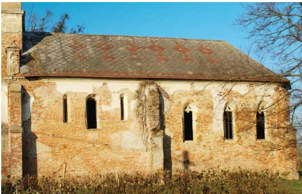
2. A templom déli homlokzata

kor a bejárat bővítésével tüntették el a román kori kaput. A géci első templom szentélyzáródását nem ismerjük, ezt a gótikus bővítéskor az alapokig kiszedték, s a templomba történő temetkezésekkel lehetetlenné tették annak régészeti módszerekkel történő kikövetkeztetését. A templomépületet kívülről eredetileg nem vakolták, így szépen érvényesült a hosszú, lapos téglákból rakott falszövet, amelyben itt-ott mázas téglák is láthatók. A belsőt erősen meszes, aprókavicsos durva vakolattal takarták. A XV. század végén vagy az 1500-as évek elején került sor a templom keleti irányú bővítésére. Ekkor a román kori szentélyt elbontották, diadalívét lefaragták, s a hajót eredeti szélességének megtartásával meghosszabbították. Az így kialakított teremtemplom mindkét külső oldalán a régi és az új (tehát a román kori és a késő gótikus) falak csatlakozását háromosztású támpillérel takarták, ugyanakkor a román kori templom támpilléreit elbontották. A déli oldalon három mérműves, csúcsíves ablakkal áttört falszakasz csatlakozik a román kori hajóhoz. Az ablakok egyszerű, halhólyag motívumos kőrácsait a barokk korban kitördelték, s az ablakbéllet záródását is félkörívesre alakították. A nyolcszög három oldalával záródó szentély négy sarkának támpillérei közül ma csak egy áll, a többi a XVIII–XIX. században lefaragták. Az északi oldalon épített új sekrestyét is elbontották a reformáció idején, az odavezető, kőből faragott, körtetagozatos számárhátívben záródó sekrestyeajtót befalazták.